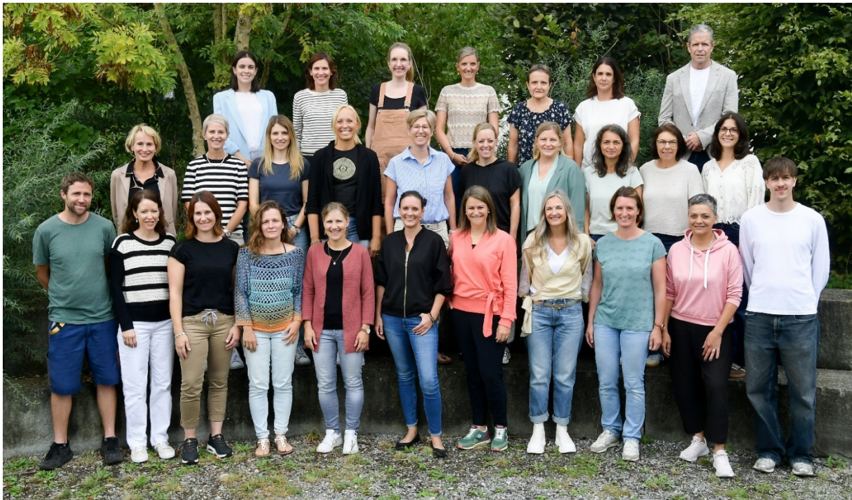
Unser Team bestehend aus Lehrpersonen, Unterrichtsassistenzen, Betreuung, Hausdienst, Verwaltung und Schulleitung