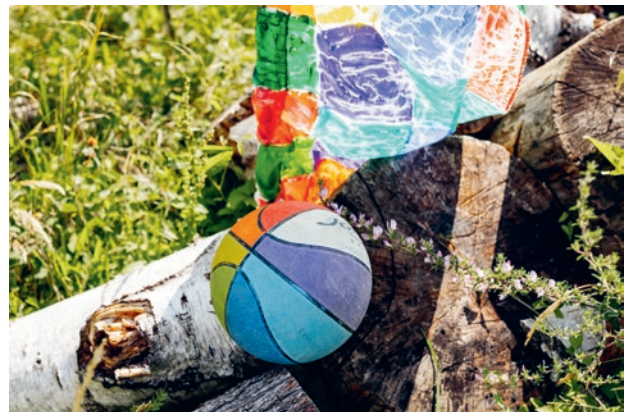
Impressionen aus dem Schulalltag