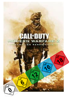
Bilder zu den Themenbereichen: Social Media, Cybergrooming, Altersbegrenzung von Computerspielen