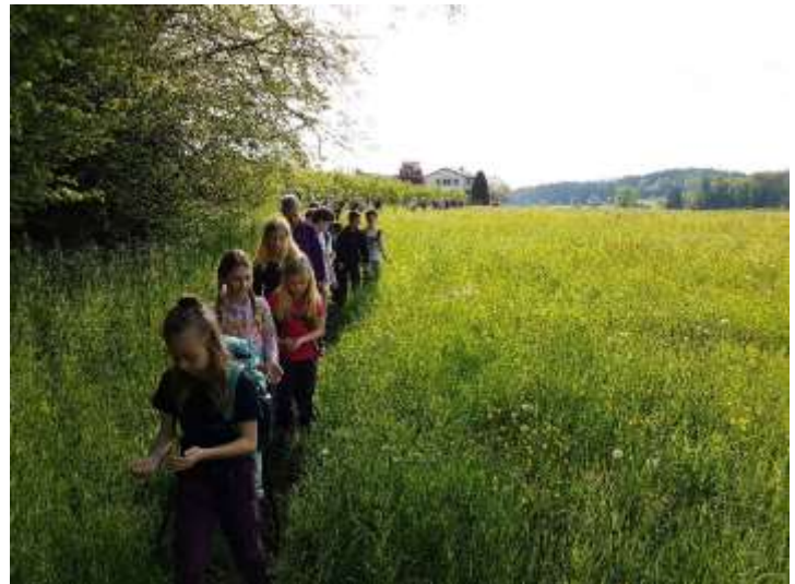
Tageswanderung zum Blauhölzli, Häggenschwil