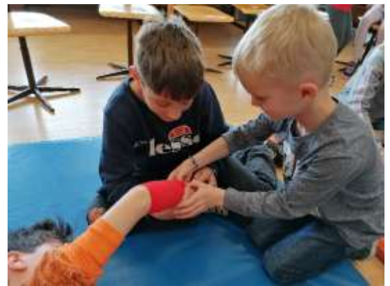
Yoga, Verbandstechnik und Herstellen einer Naturheilsalbe am Erste-Hilfe-Tag